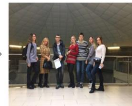
Объединение «Музейная лаборатория»